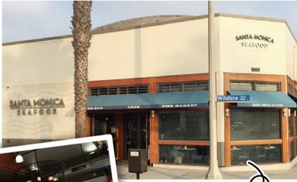
「SANTA MONICA SEAFOOD」

ロスサンゼルスに行ったら毎夕でも行きたくなる魚屋さんのレストラン「SANTA MONICA SEAFOOD」がロスサンゼルス国際空港の北のサンタモニカにあります。