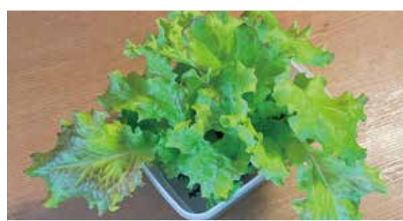
レタスなどの葉物野菜

バジルやパセリ、ミントなどのハーブ類は生命力が強いので初心者に最適！料理の飾りや香り付けにちょこっと収穫できると嬉しいです♪