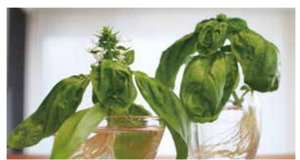
バジルなどのハーブ類

バジルやパセリ、ミントなどのハーブ類は生命力が強いので初心者に最適！料理の飾りや香り付けにちょこっと収穫できると嬉しいです♪